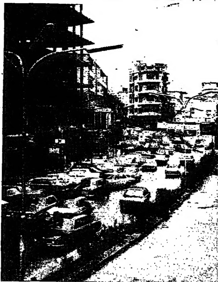
■ السيارات في شارع عاليه الرئيسي ■